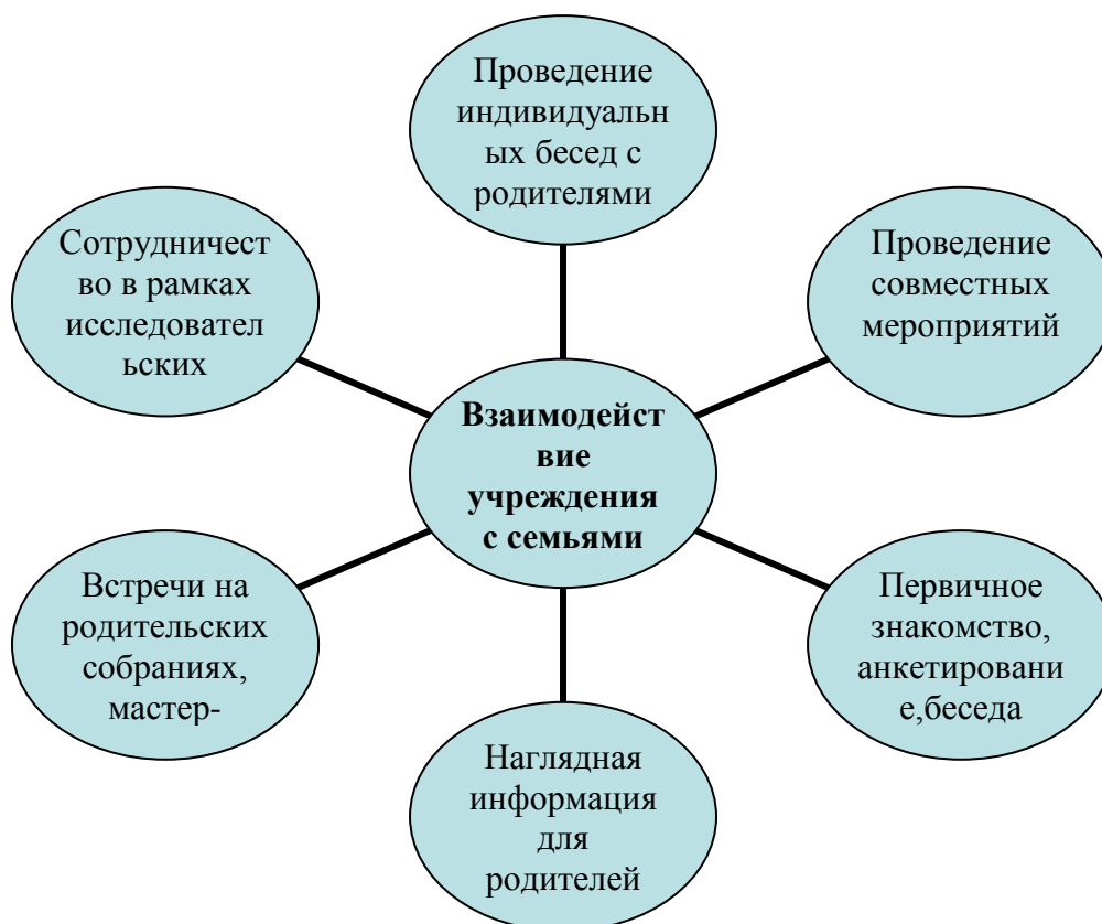
Рис.1. Содержание работы с родителями в рамках программы